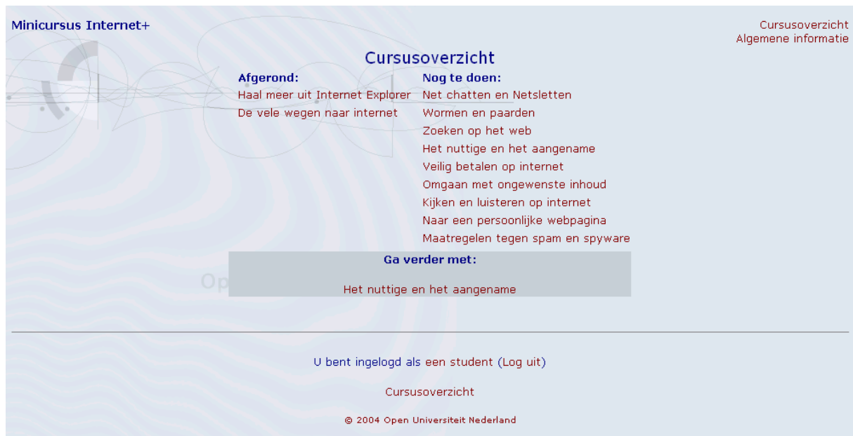
Figuur 3: Startpagina van de experimentele groep, met advies.