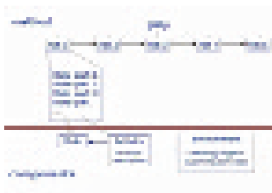
Ilustración 1. Diagrama de una obra