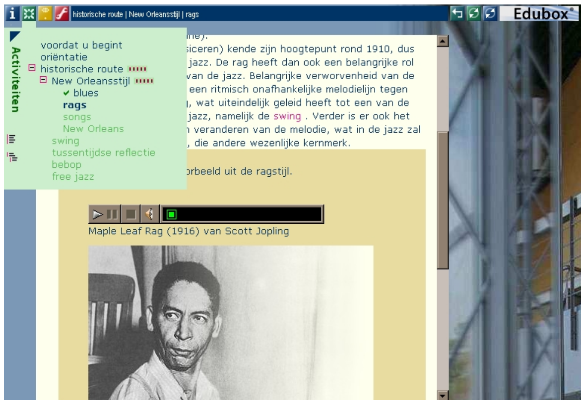
Figuur 5. Edubox weergave van een EML leereenheid (cursus over Jazz) voor de rol 'cursist'.