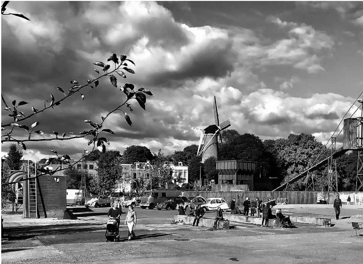
GOUDasfalt project op Open Dag