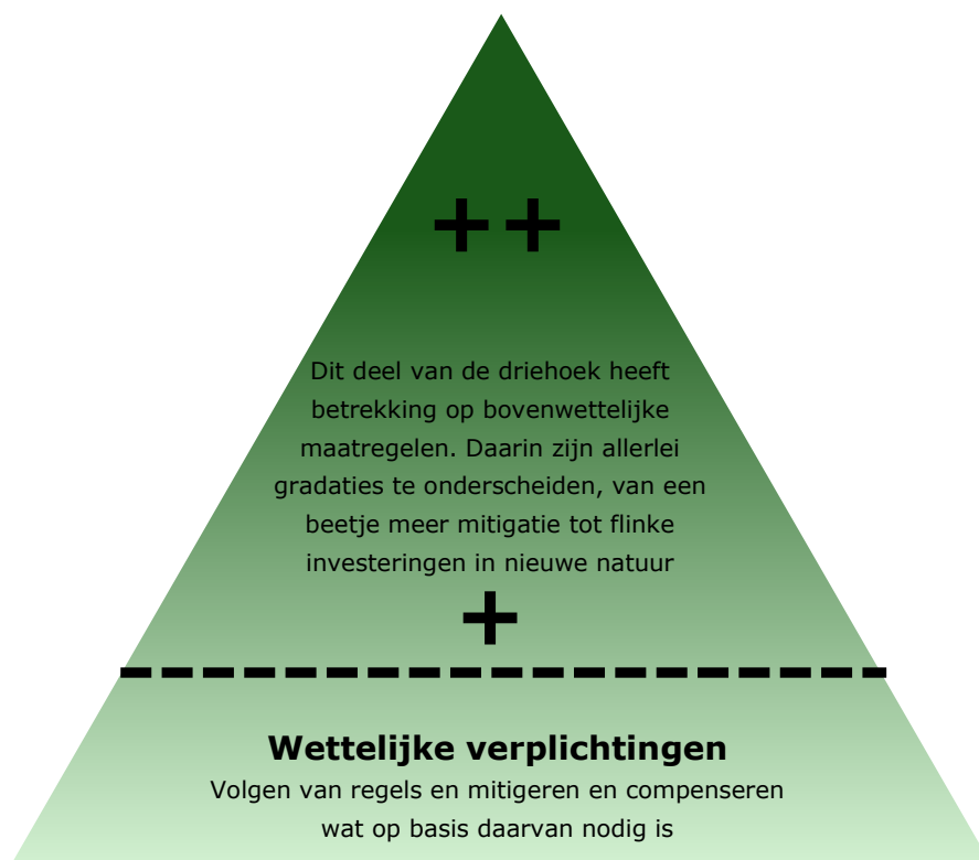
Figuur S1 Driehoek van natuurinclusief werken

Vooralsnog lijkt natuurinclusief werken meer uitzondering dan regel. Bij de meeste dominante discourses wordt natuur nog steeds beschouwd als een sector die vooral problemen veroorzaakt of niet behoort bij de verantwoordelijkheden van de betreffende organisatie. Desalniettemin is bij vrijwel alle projecten natuur een aspect waar expliciet aandacht aan wordt gegeven. De belangrijkste reden daarvoor is de bestaande wet- en regelgeving. Daaruit blijkt dat de kaders die volgen uit bijvoorbeeld de Natuurbeschermingswet, de Flora-en faunawet, de MIRT-, de milieueffectrapportages (MER) en maatschappelijke kosten-batenanalyses (MKBA) ontzettend belangrijk zijn voor de discussies over natuurinclusief werken. Door die regelgeving is het tegenwoordig vanzelfsprekend om uit te zoeken in hoeverre een ingreep mogelijk effecten heeft op beschermde soorten, habitattypen of -gebieden en te onderzoeken welke mogelijkheden er zijn om negatieve effecten te verminderen of te compenseren.