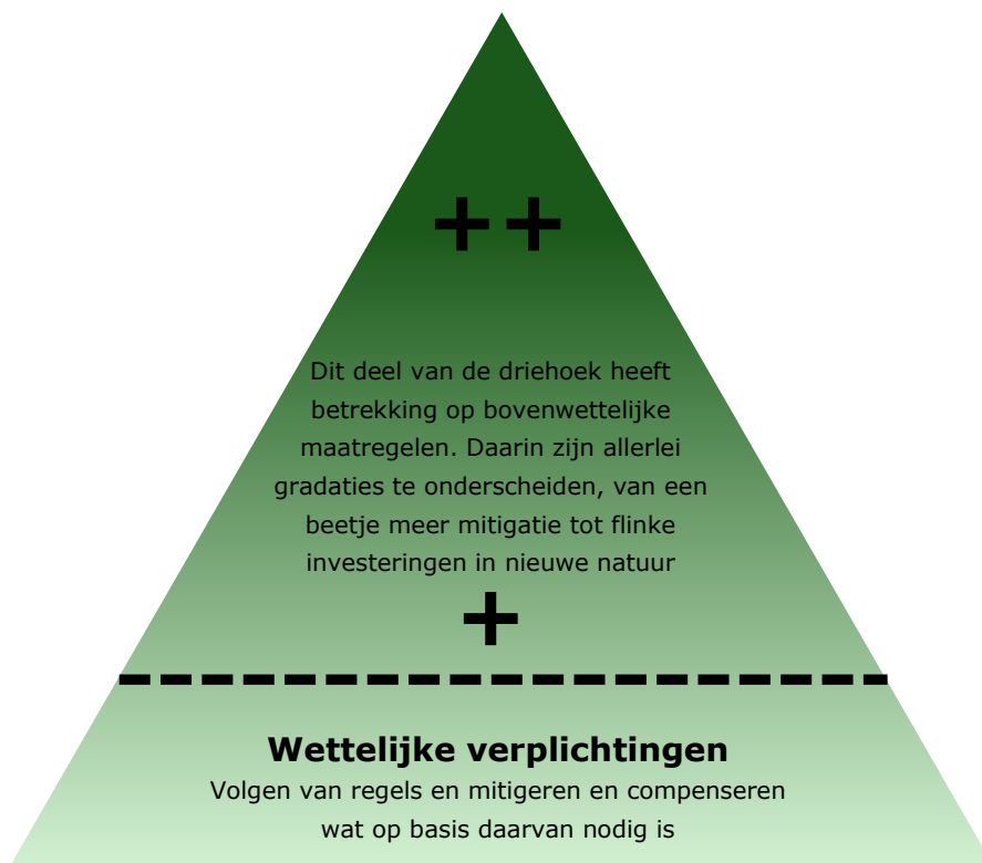
Figuur 3 Driehoek van natuurinclusief werken

In praktijk kan het begrip natuurinclusief op heel veel manieren worden ingevuld. Figuur 3 laat zien dat de basis bestaat uit wettelijke verplichtingen. Uit het onderzoek ontstaat het beeld dat hier bij alle projecten aandacht voor is. Bij een deel van de projecten wordt ook gekeken naar de meerwaarde voor natuur die gecreëerd kan worden. Dat wordt bijvoorbeeld ingegeven door maatschappelijke wensen en het is bijvoorbeeld een strategie om draagvlak te winnen bij andere partijen. De stippellijn geeft de grens tussen wettelijke verplichtingen en extra maatregelen aan. Dit is geen scherpe grens. Wat wettelijk verplicht is, is voor een deel een kwestie van interpretatie. Hoe de grens wordt geïnterpreteerd en welke consequenties dat heeft voor het omgaan met natuur verschilt van project tot project. Bij sommige projecten wordt veel tijd en energie gestoken in het naar beneden trekken van de lijn. Vaak hangt dit samen met een discours waarin natuur en wetgeving als negatief en problematisch worden gezien. De winst voor natuur is bij deze werkwijze afwezig of minimaal. Overal het algemeen creëert dit een weinig uitdagende en niet inspirerende manier van omgaan met natuur.