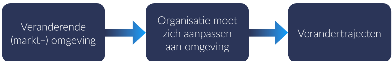
Figuur 1. De klassieke verander-redenering

omgevingsscanners, die dag-in-dag-uit in de gaten houden wat er buiten de deur allemaal gaande is. Diezelfde managers moeten vervolgens beslissen hoe de organisatie strategisch moet reageren op de gesignaleerde trends, trendbreuken en discontinuïteiten. Die strategische reacties moeten dan weer worden vertaald naar tal van verandertrajecten die met grote spoed moeten worden ingezet, om niet al te veel achter te lopen bij de omgevings- en marktontwikkelingen en datgene dat de concurrentie doet. Dus: