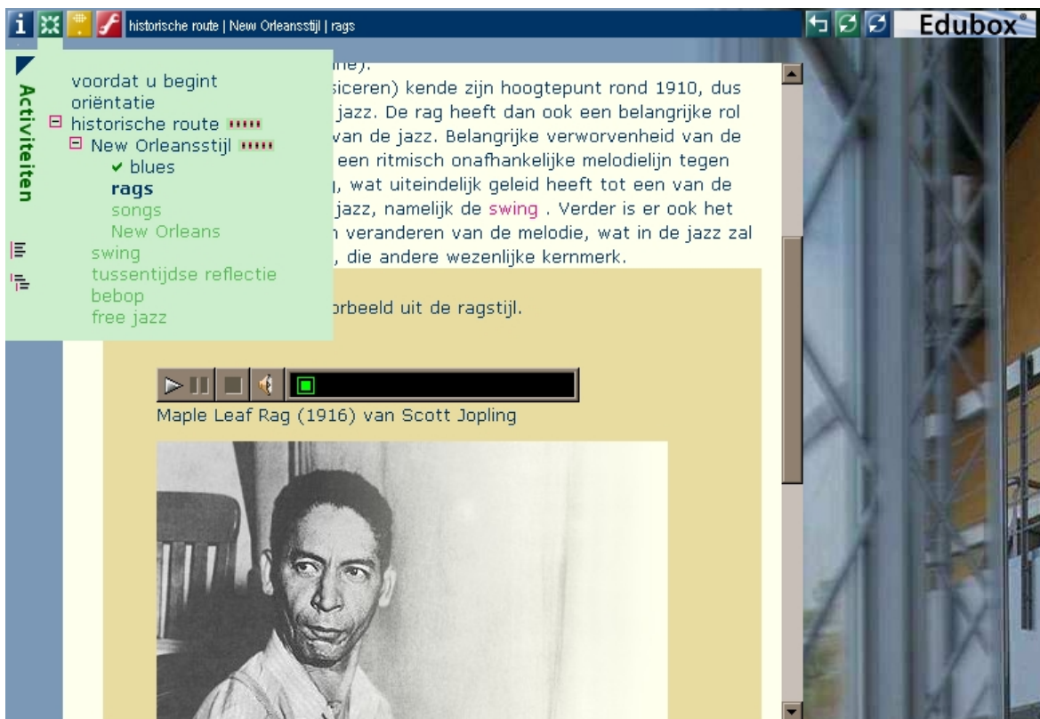
Figuur 5. Edubox weergave van een EML leereenheid (cursus over Jazz) voor de rol 'cursist'.