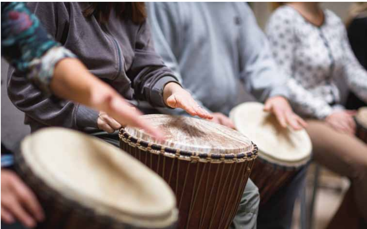
Afbeelding 1: Ervaringsgerichte behandelinterventies, zoals vaktherapie, blijken goed aan te sluiten bij het cognitief en emotioneel functioneren van mensen met LVB.

en behandelingen vanuit de FACT-LVB-teams, kunnen versterken. Vaktherapeuten willen mee in de verschuiving die gaande is van zorg en behandeling intramuraal naar de directe omgeving van de cliënt, om zo nog meer te kunnen aansluiten bij wensen en behoeften van cliënten. In de praktijk valt op dat mensen met LVB en bijkomende problematiek binnen hun eigen leefomgeving nauwelijks een beroep kunnen doen op vaktherapie. Inzicht verkrijgen in hoe en wanneer vaktherapie binnen ambulante behandelteams structureler kunnen worden ingezet, is de kern van het onderzoeksproject '(Be)Leef in de wijk'.