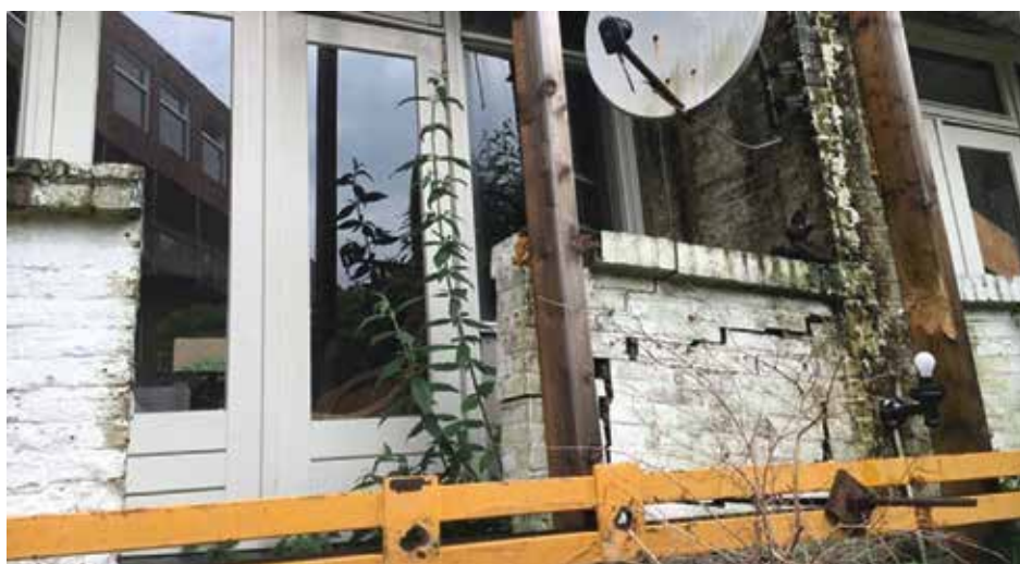
Figuur 1. Instortingsgevaar van één van de huizen in de Margrietstraat door rottende funderingspalen door te lage grondwaterstand (Rijnmond, 2016) 2 .

Om de knelpunten in de samenwerking te identificeren is het conceptueel model van