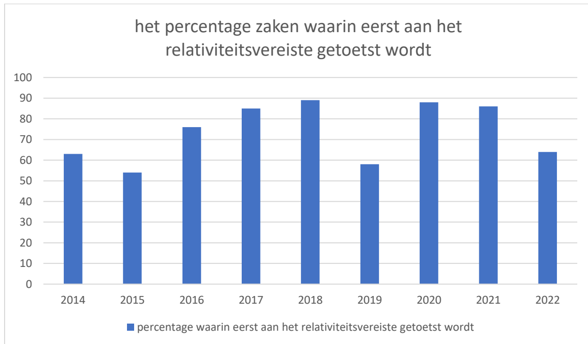
Figuur 2 Het percentage zaken waarin eerst aan het relativiteitsvereiste getoetst wordt. 54

Uit de gegevens weergegeven in figuur 1 is te berekenen wat per jaar het percentage is van de voor ons relevante zaken waarin de gronden eerst getoetst worden aan het relativiteitsvereiste in plaats van eerst inhoudelijk te toetsen. De resultaten zijn weergegeven in figuur 2.