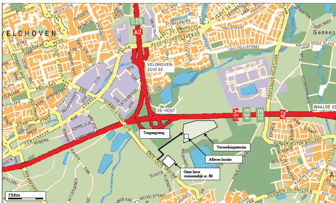
Locaties NBV 134e themadag