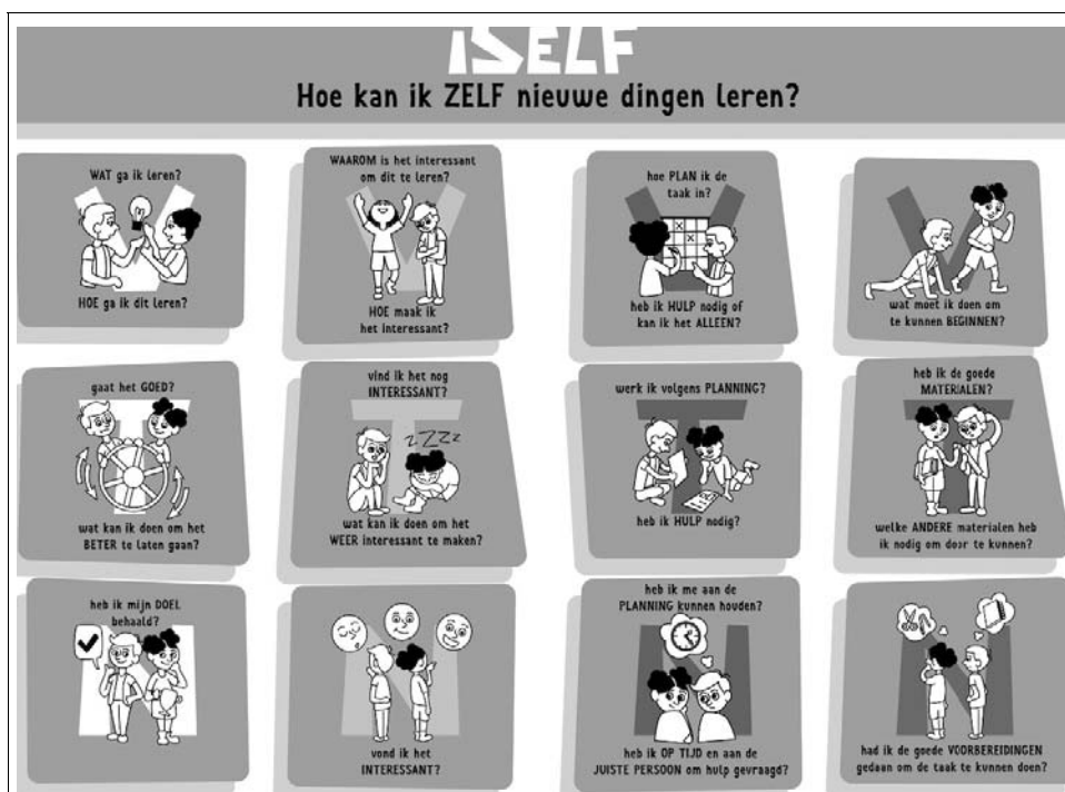
Figuur 3. iSelf schema.

Dit betekent dat leraren geen 'losse' studielessen geven, maar aandacht geven aan ZGL geïntegreerd in de reguliere lessen. Hierdoor leren leerlingen strategieën direct toe te passen binnen de juiste context. In aansluiting op het expliciet en geïntegreerd onderwijzen van ZGL is het tenslotte van belang dat leraren leren omgaan met verschillen tussen leerlingen en hun onderwijs hierop afstemmen. In onderstaande tabel wordt beschreven hoe de principes uit Figuur 1 concreet in iSelf zijn uitgewerkt: zie Tabel 3.