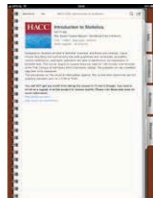
cursus iTunesU op iPad