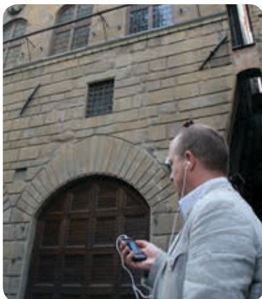
Veldwerk van studenten in Florence ondersteund met Augmented Reality

Verschillende instellingen voor hoger onderwijs voeren pilots uit om te ontdekken in welke didactische scenario's leren met mobiele apparaten van meerwaarde is, en hoe mobiel leren na deze pilots kan worden ingebed in het onderwijs. De daarbij gebruikte onderwijsmaterialen en apps kunnen onder de noemer van OER geplaatst worden.