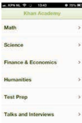
app Khan Academy

Jetpack , een door de Purdue University ontwikkelde auteursomgeving met bijbehorende mobiele apps waarmee onderwijsontwikkelaars zelf interactief onderwijsmateriaal voor mobiele apparatuur kunnen maken. Zij kiezen voor deze benadering, omdat het uitbrengen van onderwijsmateriaal in de vorm van e-books in hun ogen weinig didactische meerwaarde biedt.