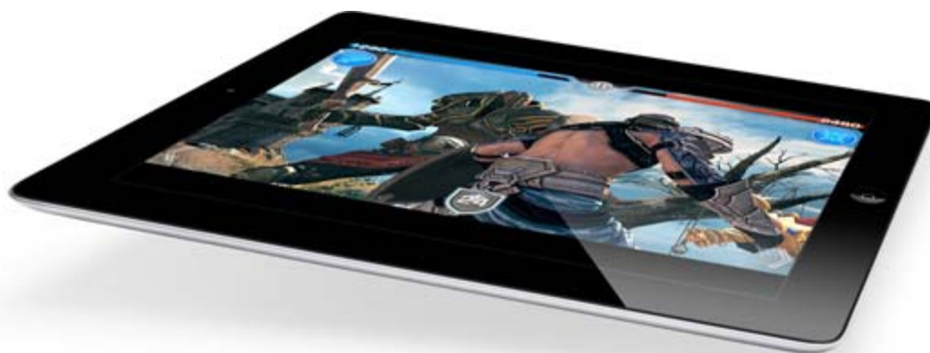
Figuur 1: Ipad 2

Verskillende deelnemers in het onderwijslab hebben erop gewezen dat onderwijs over het algemeen conservatief is en ICT veranderingen lang buiten de deur houdt. Juist op dit punt zijn er echter de komende jaren grote veranderingen te verwachten omdat mobiele technologie met de komst van Apple's Ipad in een stroomversnelling terecht is gekomen. Snel zullen dit soort tablet PC's goedkoper zijn dan een stapel studieboeken, maar al heel snel en onvermijdelijk duidelijk maken dat louter het gebruik als Ebook (dus als goedkopere uitlevervorm van gedrukte boeken) in geen verhouding staat tot de andere mogelijkheden (zoals hierboven aangestipt als de centrale kenmerken van web 2.0 en next web ) die deze technologie zal bieden. Binnen enkele jaren hebben alle leerlingen in alle vormen van onderwijs alle informatie van de wereld permanent ter beschikking, multimediaal, locatie- en persoonsspecifiek.