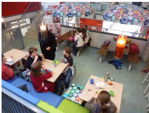
Figuur 3: Een nieuwe school zonder klasruimtes: Wittering.nl in Rosmalen

De grenzen tussen formeel en informeel leren zullen steeds vager worden.