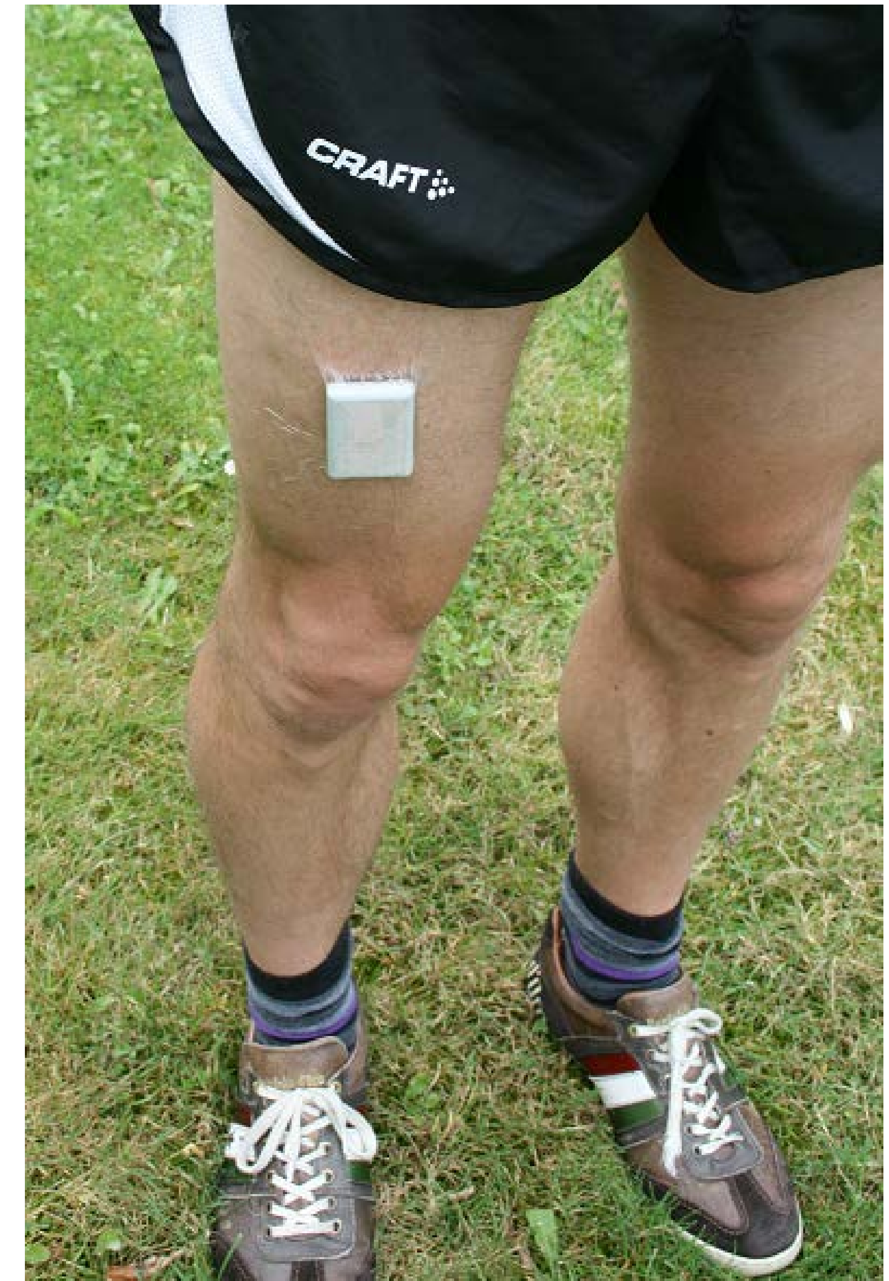
Figuur 1: Fysieke activiteit werd gemeten met de ActivPAL3™ accelerometer

Fysieke activiteit is negatief geassocieerd met schoolverzuim door ziekte in adolescenten meisjes, maar niet in jongens. Daarnaast is fysieke activiteit geassocieerd met cardiovasculaire fitheid, terwijl de norm gezond bewegen niet sig. geassocieerd is met deze gezondheidsuitkomsten. Gebaseerd op deze resultaten concluderen wij dat iedere toename in fysieke activiteit bijdraagt aan de gezondheidsuitkomsten en mogelijk verlaagt fysieke activiteit indirect schoolverzuim door ziekte door het verbeteren van de cardiovasculaire fitheid.